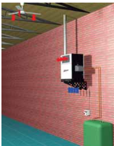
GS-060 con depósito de combustible de doble pared y desestratificador de aire GS-060 with double wall fuel tank and air destratifier GS-060 avec réservoir de combustible à double paroi et déstratificateur d'air

Installation example / Exemple de montage