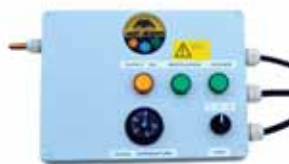
Control remoto mural Wall remote control Télécommande murale