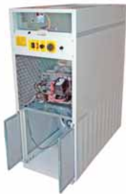
Quemador insonorizado. Filtro de admisión de aire. Sound insulated burner. Air inlet filter. Brûleur insonorisée. Filtre d'admission d'air.