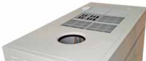
Rejilla de aire multidireccional Multidirection air grid/multidireccional Grille d'air multidirectionnel